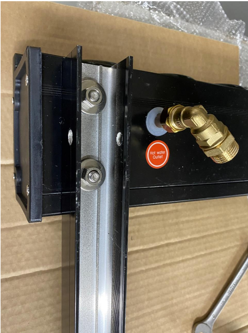
Montage header op verticale ligger – gebruik dop 13