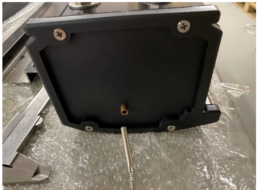
Plaatsen sensor in header Na plaatsing buisje licht vervormen (trekontlasting)